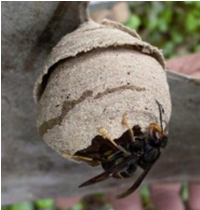
Nid primaire (au maximum de la taille d'un gros melon )